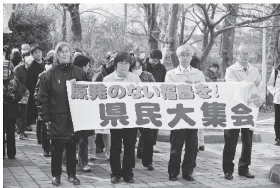
2017年3月18日 郡山開成山にて 「原発のない福島を！県民大集会」

とりわけ、「憲法改正」の問題では、2006年の「教育基本法」の改悪反対運動から県教組との連携を密にし、平和教育や平和運動を進めてきました。今、安倍政権は、「教育基本法」改悪後、教育の国家統制を強め、「教育勅語」復活をも示唆する「道徳」の強化による、子どもたちの心の評価を強要しています。